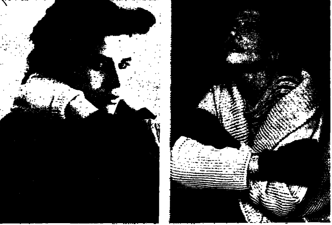
هل سالت فاني عن سر الصمت في سحرها المشتعل